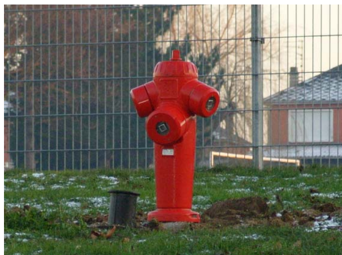
La sécurité incendie pour la salle polyvalente

Une alimentation en eau a été réalisée entre la rue des Violettes (près de la Salle Polyvalente) et la rue de l'Épinette, efficace en cas d'incendie.