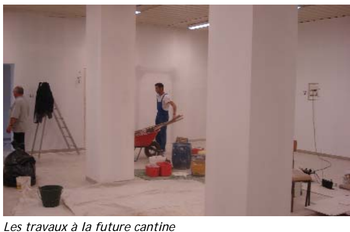
Les travaux à la future cantine

La cantine a été déplacée de la Salle Polyvalente à l'ancien local de « Chacal + » non utilisé (200 m plus bas).