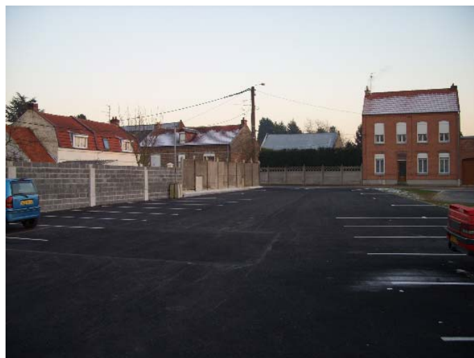
Le parking de la Place François Mitterrand

Le nouveau parking a été aménagé à l'emplacement de l'ancienne Salle des Fêtes.