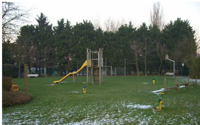
L'aire de jeux « aux moutons »