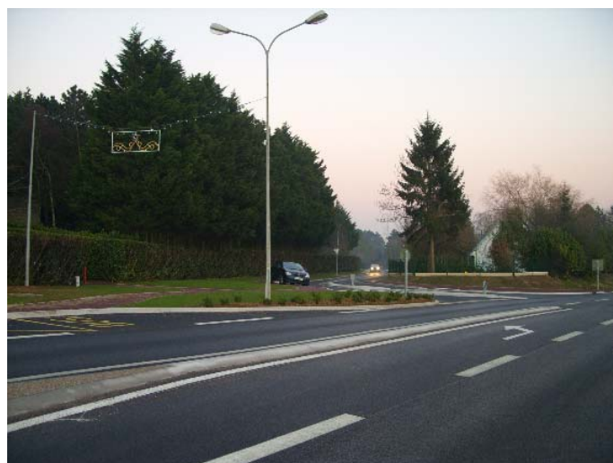
La nouvelle voirie aux Picadores et Conquistadores

Des travaux de voirie réalisés sur la route départementale 942 au droit des Picadores et Conquistadores permettent désormais aux véhicules de rentrer et de sortir de cette résidence en toute sécurité. Il faut rappeler que cet aménagement a été financé par le Conseil Général du Nord, les acquisitions foncières ont été, quant à elles, prises en charge par la commune. Des travaux d'élagage d'arbres, de tailles de haies ont été réalisés. Des jeux pour les jeunes enfants ont été installés, d'autres le seront prochainement.