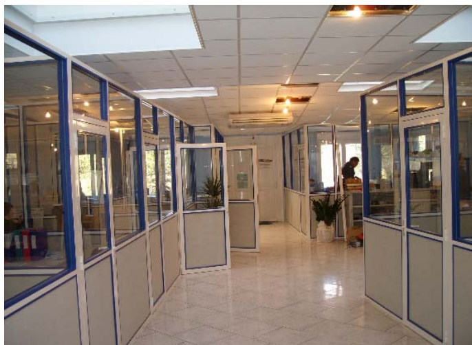
L'extension de la mairie

Il fallait terminer la rénovation et l'extension de la Mairie ; des travaux importants : le renforcement de la charpente, la remise en état du premier étage qui n'était plus utilisé. Au rez-de-chaussée la restauration des anciens bureaux et un sas d'entrée pour les handicapés, trop souvent oubliés. De nouveaux bureaux ont été construits avec des cloisons pour une confidentialité avec les assistantes sociales et les adjoints. Une climatisation a été installée ainsi qu'un faux plafond conforme à la sécurité car les fibres de laine de verre qui passaient par les trous du plafond constituaient un certain danger pour la santé de notre personnel. Le plafond sera démonté et remis prochainement en état afin d'enlever les dix centimètres de polystyrène ce qui est interdit dans des locaux publics !!!