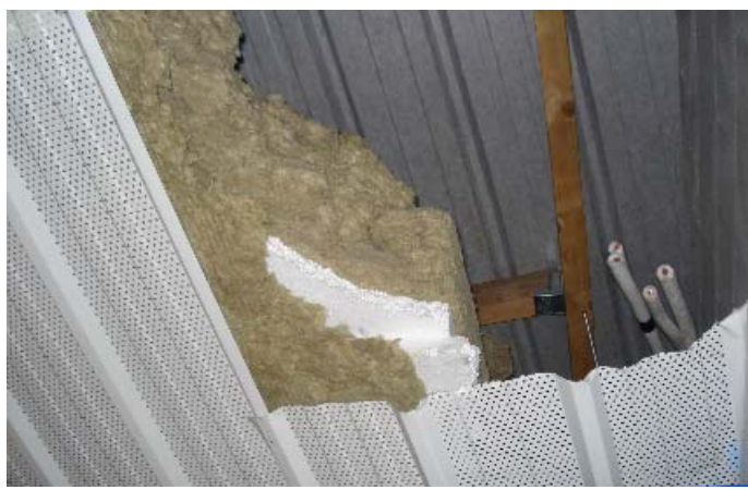
Avant de refaire le plafond...!

L'Eglise a vu son chœur rajeunir : la construction en bois, par notre service technique, a été recouverte de moquette ce qui lui donne une nou-