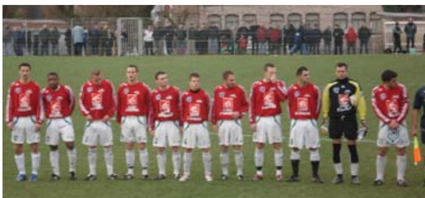
Photo prise lors du 7 ème Tour : CASE - FRESNOY 1-0 Le C.A.S. Escaudœuvres à l'honneur pour le 8 ème tour de la Coupe de France de Football

Notre ville commence à se structurer. De gros efforts sont aujourd'hui faits par notre équipe municipale que je remercie. Le sport nous a fait vibrer. Notre équipe locale de football est arrivée au firmament de la notoriété. Ils auraient pu encore aller plus loin mais tout à une fin... Grand merci.