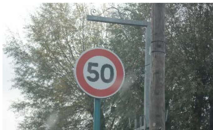
Un des nombreux nouveaux panneaux lumineux

Les panneaux clignotants ont été installés rue du Marais et rue Jean Jaurès.