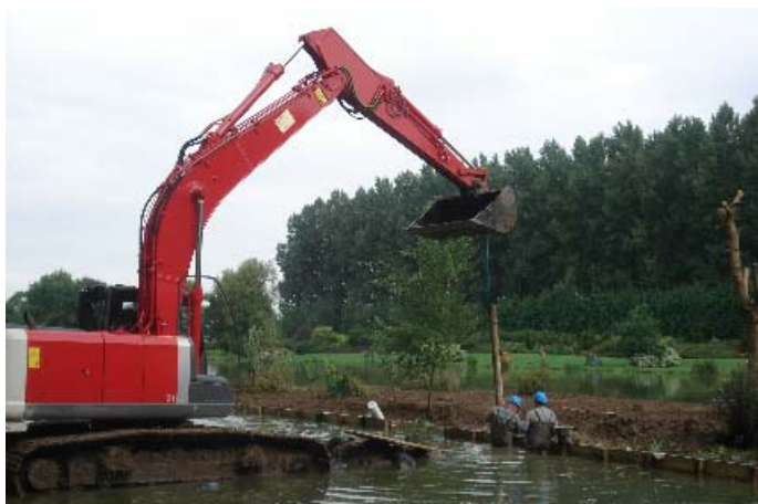
Les travaux de l'îlot de l'étang

L'îlot de l'étang communal a été renforcé après la fin des travaux du club house de la pêche et l'aménagement du parking. L'an prochain les berges de l'étang seront, à leur tour, renforcées afin que le site entretenu à l'année par un employé communal, soit de plus en plus accueillant.