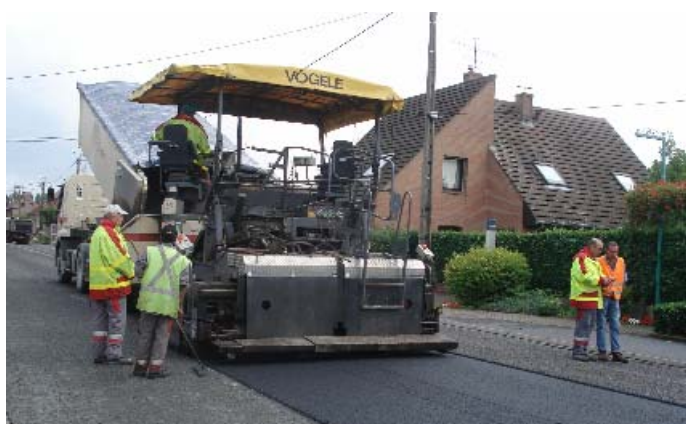
La pose de l'enrobé anti-bruit sur la R.D. 630

Les services techniques municipaux ont procédé à divers travaux d'aménagement des abords de l'école maternelle Suzanne Lanoy. Des barrières ont été confectionnées et posées de part et d'autre de