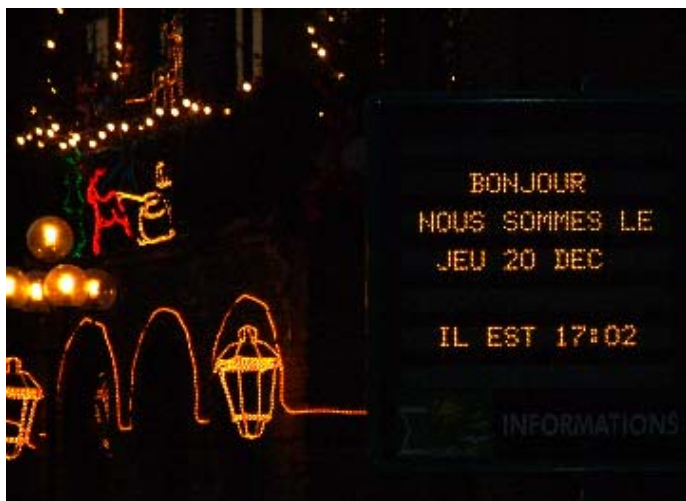
La mairie illuminée et le panneau près de l'église

Deux panneaux informatique modernes en centre ville et deux défilantes au stade Marcel Dhordain et à la Salle Polyvalente.