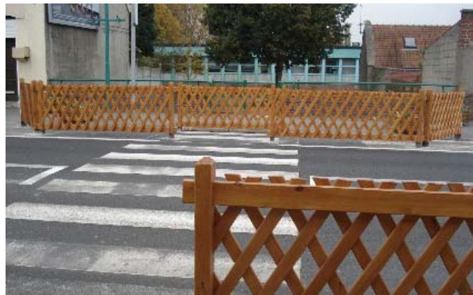
Les barrières sécurisantes à Suzanne Lanoy

la rue Jean Jaurès face au passage piétonnier afin de sécuriser au maximum la traversée des enfants se rendant et sortant de l'école. Un fleurissement viendra compléter cet aménagement.