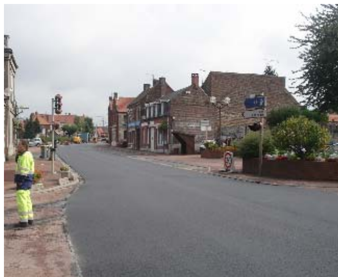
La rénovation de la R.D. 630

Le Conseil Général du Nord a réalisé d'importants travaux de rénovation de la voirie rue Jean Jaurès (R.D. 630) du chemin particulier à la sortie de la commune en direction d'Iwuy. Un revêtement anti-bruit a été posé. Des aménagements visant à accroître la sécurité ont été réalisés en particulier afin de réduire la vitesse. Ces travaux ont été complétés par la pose d'une signalisation adaptée mise en place par la commune.