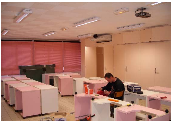
La future classe informatique à Joliot Curie