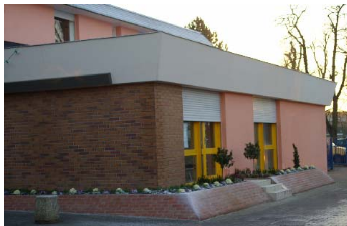
La rénovation de la Poste

La Poste, à l'abandon depuis plus de dix ans, a été rénovée : une nouvelle étanchéité pour la toiture (le local de la directrice fuyait de partout) et de nouvelles peintures en font un local public qui se doit d'être conservé pour notre population. L'ancien logement du Receveur n'étant plus utilisé, c'est Scaldocouture qui pourra s'y installer quand les travaux seront terminés.