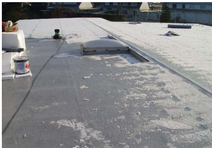
La toiture de l'école Joliot Curie

Pour l'école primaire Joliot Curie : l'étanchéité de la toiture est en cours de réalisation à la suite de fuites dans les classes. La classe informatique est terminée et sera fonctionnelle elle aussi en janvier. Là encore nous en reparlerons... L'an prochain les peintures extérieures seront refaites.