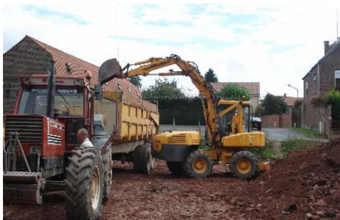
Le futur square rue d'En Bas

Un square rue d'En Bas sera bientôt aménagé en plantation arbustives et en pelouse.