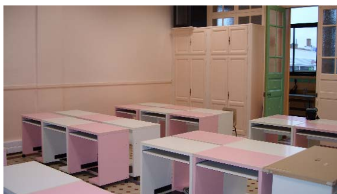
La future classe informatique à Jean Lebas