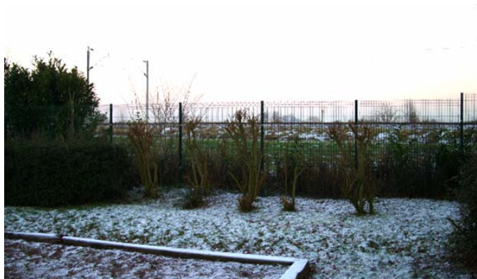
La clôture entre le Square et la voie ferrée

Le Square rue Romain Rolland a été sécurisé par une clôture pour éviter que les enfants n'aillent sur la voie ferrée. De nouveaux jeux ont été installés (ainsi qu'aux Conquistadores Picadores) ainsi que de nouveaux bancs pour remplacer ceux qui étaient en mauvais état. Les mêmes travaux ont été faits au terrain « aux moutons » entre la Cité Tisserin et la rue de Bouchain.