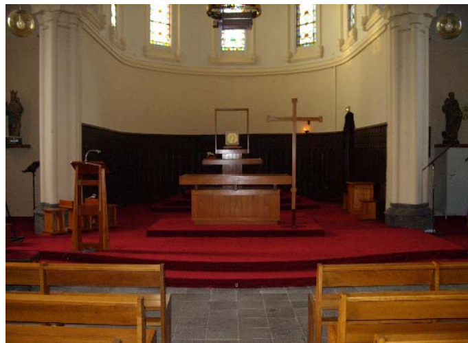
La rénovation du chœur de l'église

velle forme. Bientôt une nouvelle salle de catéchisme sera réalisée entre la poste et l'entrée de l'Eglise.