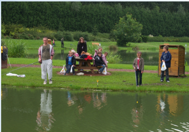
Journée de pêche à l'étang communal