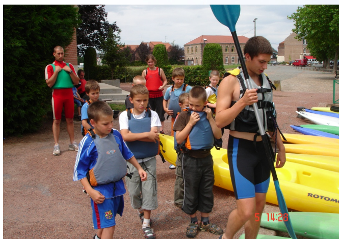
Découverte du Canoë kayak à Cambrai, au Bassin Rond et à Saint Laurent Blangy