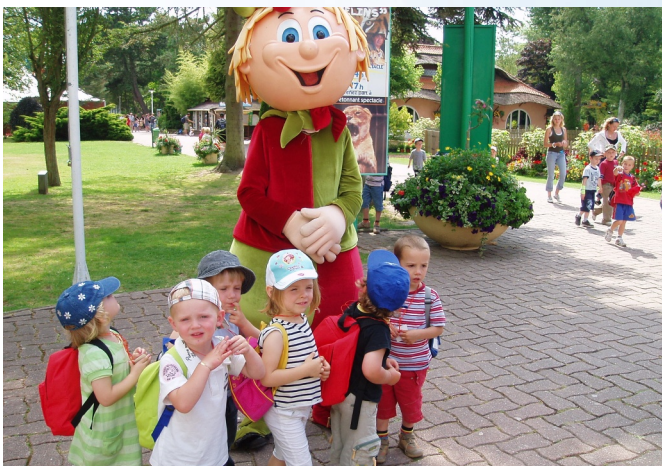
Rencontre avec la mascotte du Parc Bagatelle