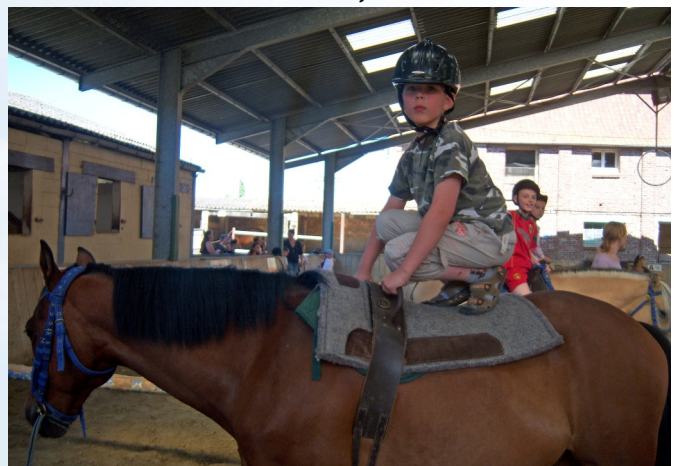
Initiation à l'équitation à Hamel