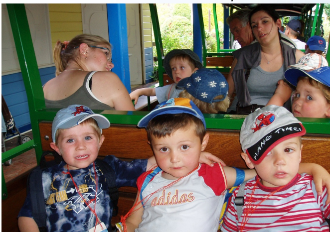
Petit tour de train