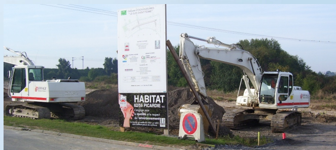
Des futures maisons près des commerces du centre ville et à proximité de la zone commerciale Auchan

Rappelons que la commune a perdu 800 habitants en plus de 15 ans par manque de constructions neuves. Notre effort de rattrapage nous oblige à construire 30/35 logements par an d'ici 2023 si l'on veut rattraper la population des années 1980 (4300 habitants) car nos infrastructures le permettent.