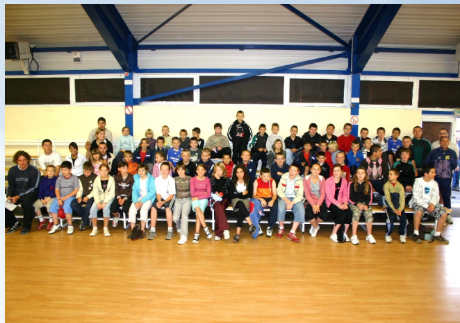
Le groupe des sportifs de juillet

Les ados des centres de loisirs et sportifs ont, comme l'an dernier, eu la possibilité de suivre une Formation aux Premiers Secours (AFPS).