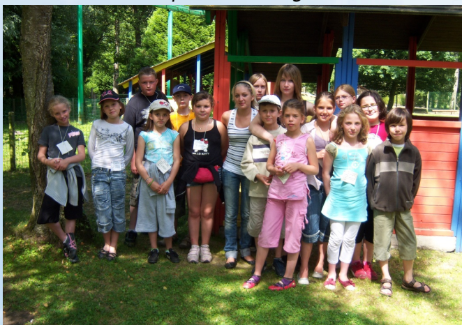
Journée à Loisiparc à Aubigny au Bac