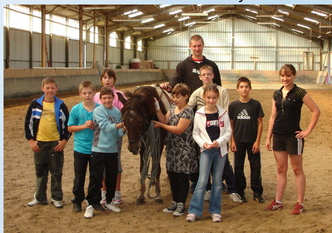
Initiation à l'équitation à Sancourt