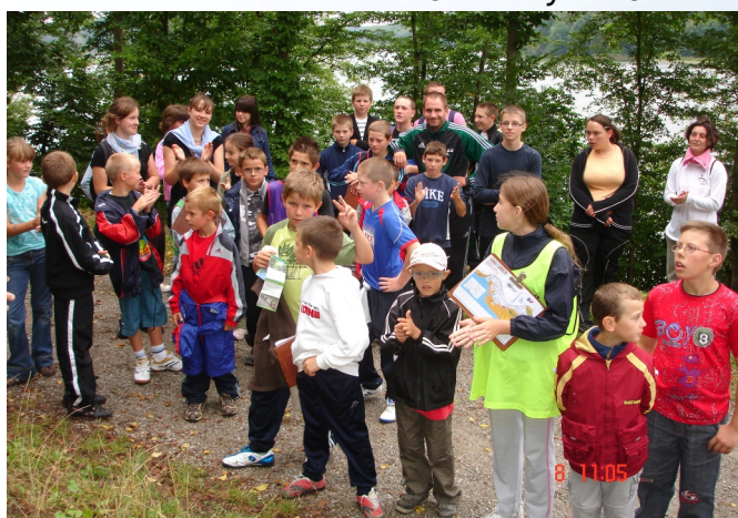
Avant le départ pour la course d'orientation au Val Joly