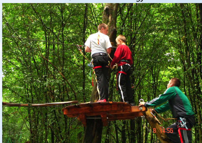
Accrobranche au Val Joly