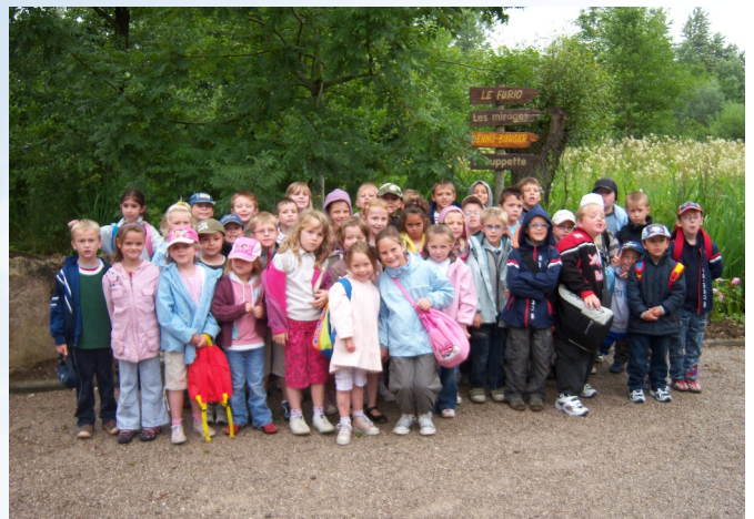
Journée à Loisiparc à Aubigny au Bac

Séjour à Leffrinckoucke, journée pêche, initiation à l'équitation, bowling, camping, patinoire, piscine, visite de parcs de loisirs avec en apothéose une journée au parc Astérix pour clôturer cette saison de loisirs.