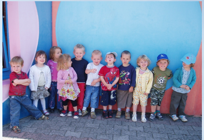
Les 2-3 ans au complet