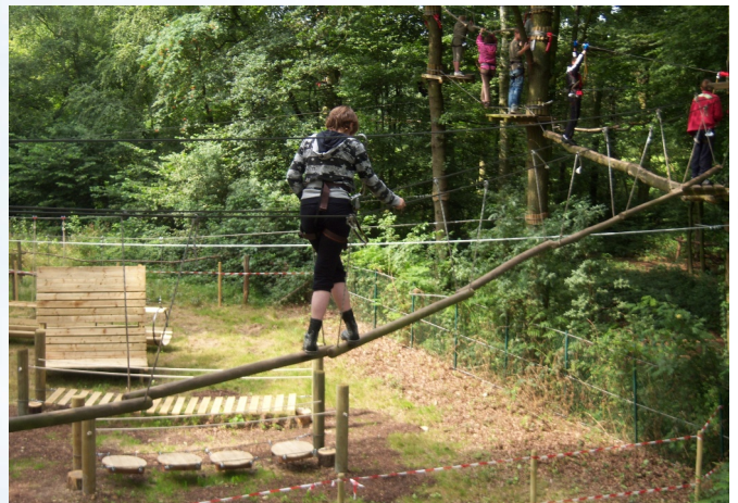
Découverte Chloro-fil à La Neuville