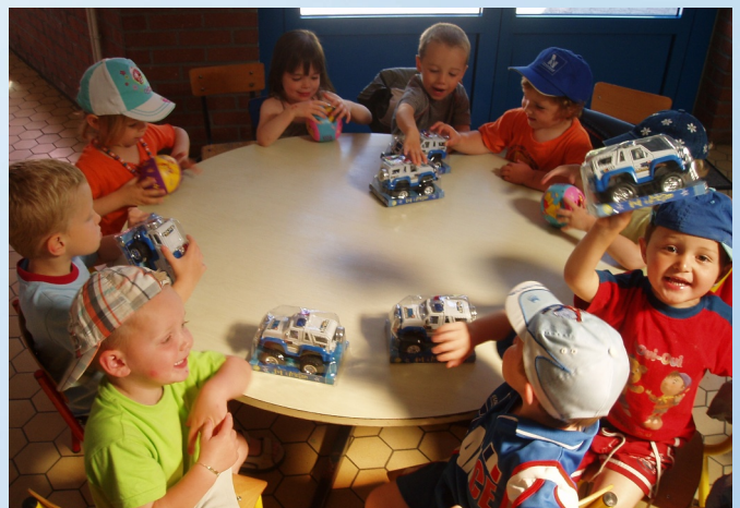
Chaque enfant a reçu une surprise...