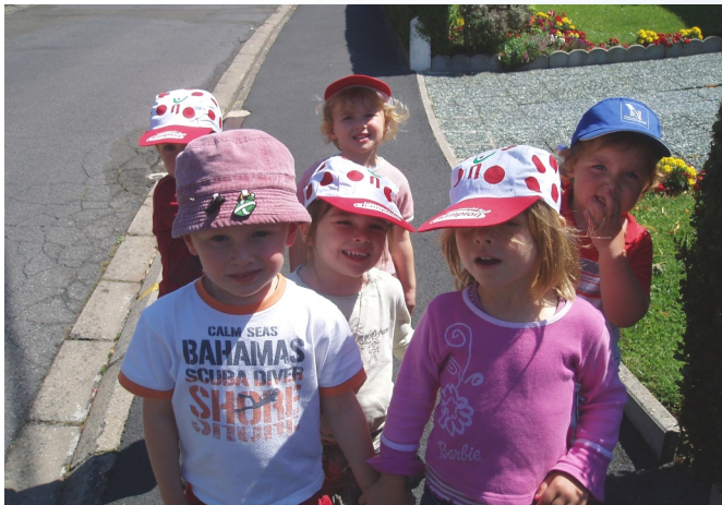
En route vers la salle des sports