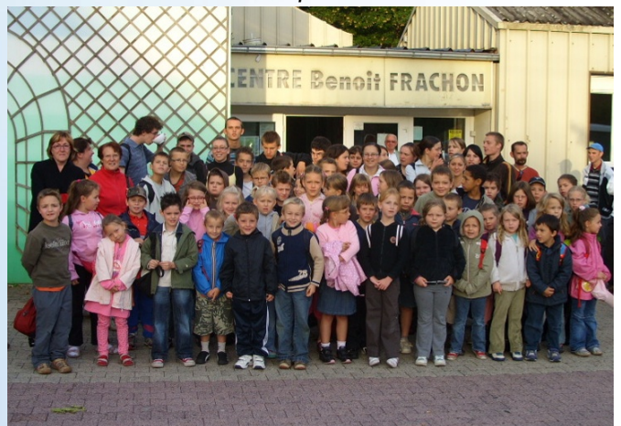
Avant le départ pour le parc Astérix