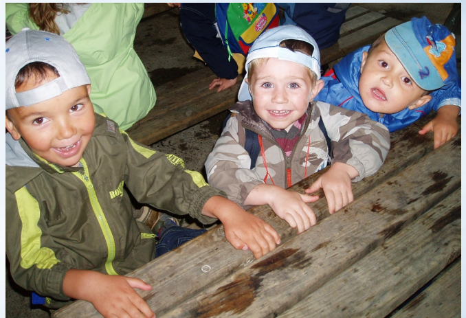
Nous prenons place pour le pique nique