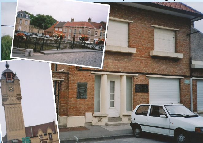
Visite de la ville de Bergues