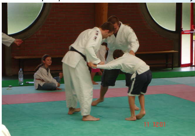
Découverte du judo