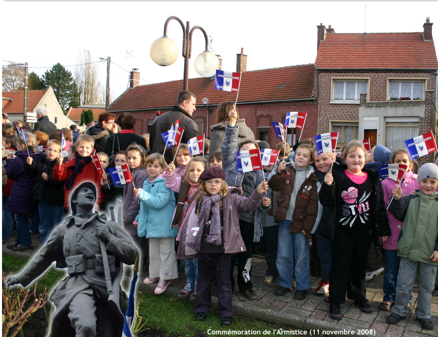
Commémoration de l'Armistice (11 novembre 2008)