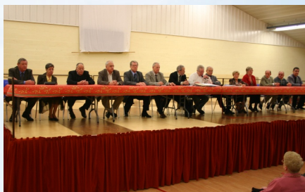
20/11/2008 U.N.R.P.A. Assemblée générale à la Salle polyvalente