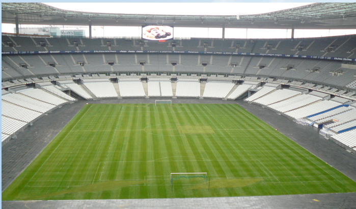
La pelouse mythique du Stade de France