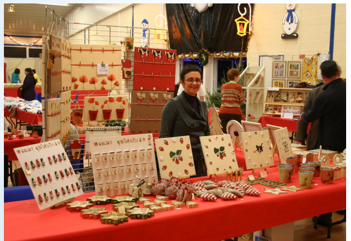
Une exposante réjouie