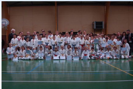
02/11/2008 Karaté Coupe de la Ville à la Salle Léo Lagrange