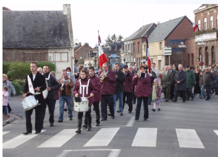
11/11/2008 L'Harmonie municipale lors du 90 e anniversaire de l'Armistice