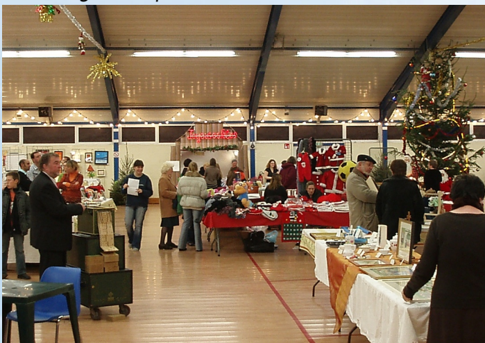
Quelques uns de nos 40 exposants