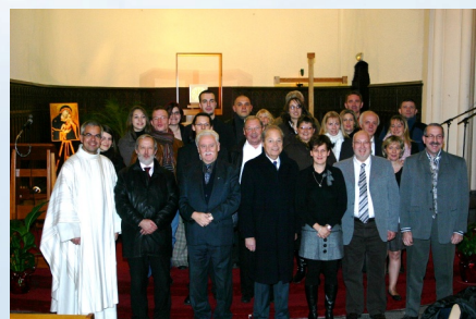
22/11/2008 Harmonie municipale Audition donnée lors de la messe en l'Église Saint Pierre