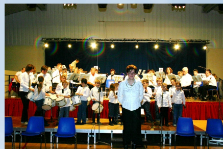
21/11/2008 Harmonie municipale Concert de la Sainte Cécile à la Salle polyvalente