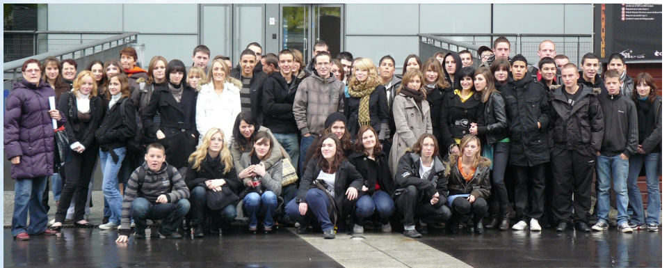
Le groupe de jeunes devant le stade

Ce programme a réjoui tous les jeunes qui ont participé à cette sortie.