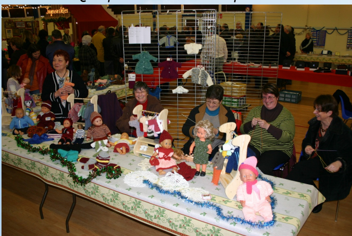
Le tricot pour habiller des poupées