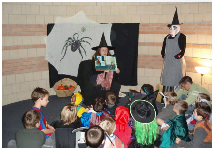
05/11/2008 Médiathèque Lecture spéciale Halloween