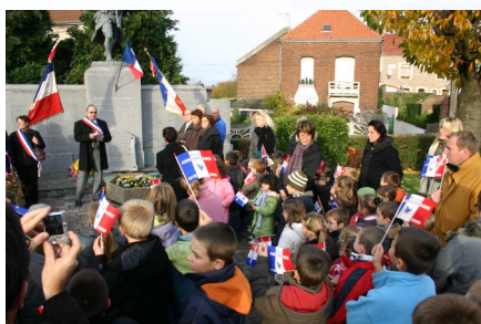
Célébration du 90 e anniversaire de l'Armistice par les élèves des écoles