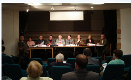
15/11/2008 D.D.E.N. Assemblée générale à la Médiathèque