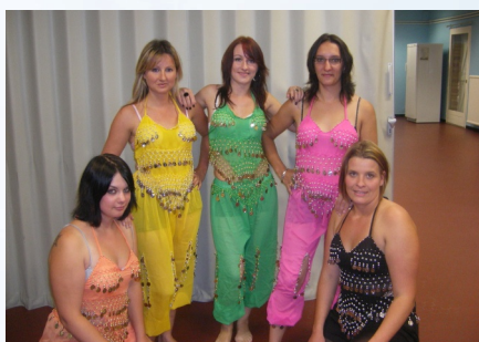
08/11/2008 Les Jeunes Talents Show Tour 2008 à la Salle polyvalente