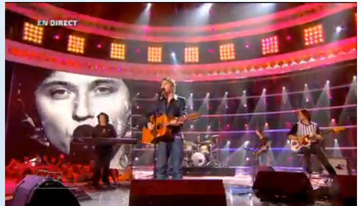
Raphaël lors de l'émission Star Academy