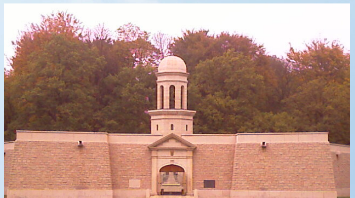
Le Mémorial de Longueval dédié à la mémoire des combattants d'Afrique du Sud qui ont donné leur vie pour la France