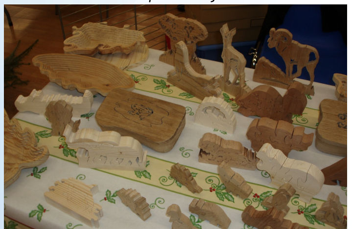
Des puzzles en bois