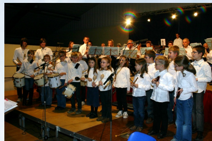
La Chorale de l'École de Musique lors du concert de la Sainte Cécile