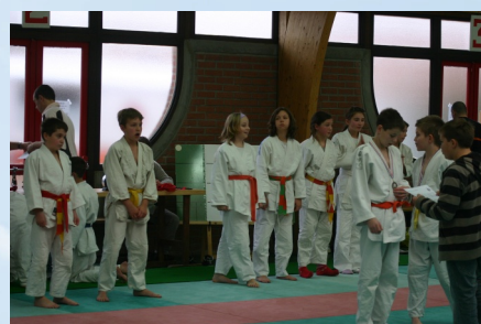
30/11/2008 Judo Challenge à la Salle Léo Lagrange