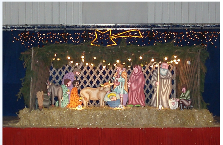
La crèche de Noël