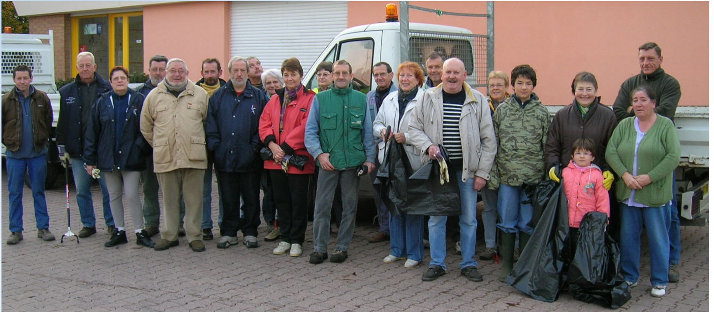
Les participants du nettoyage citoyen

Le groupe s'est scindé en quatre équipes pour collecter les déchets rue du 11 Novembre, sur la voie ferrée de la sucrerie, le chemin qui longe la voie ferrée et le chemin Candelier. C'est dans ce dernier qu'a été ramassé la plus grande quantité de déchets, principalement des matériaux de constructions, très vraisemblablement déposés par les artisans, tôt le matin ou tard le soir, quand la déchetterie est fermée.