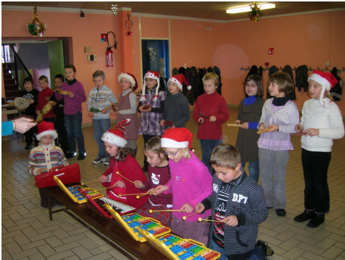
École primaire JOLIOT-CURIE