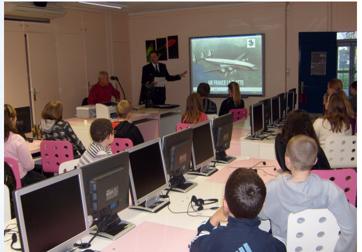
École primaire JOLIOT-CURIE