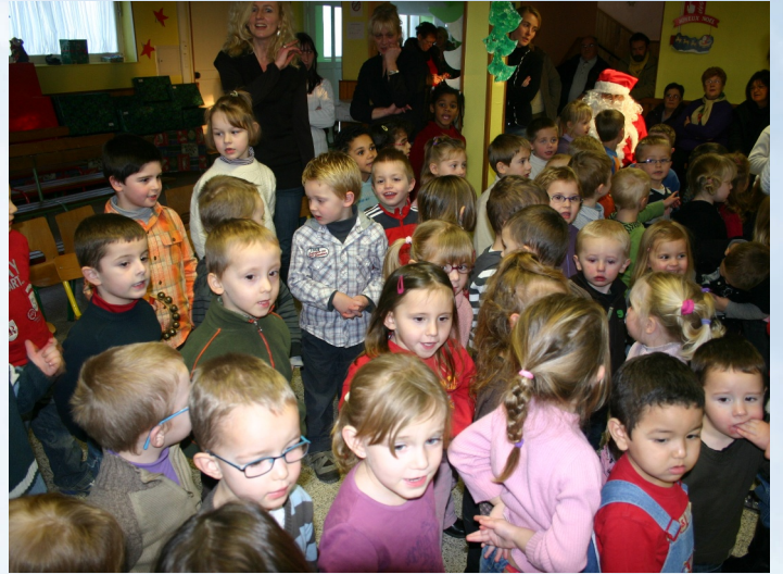
École maternelle Suzanne LANOY