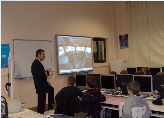
École primaire Jean LEBAS