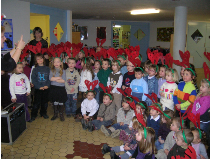
École maternelle Paul LANGEVIN

De plus, chaque école primaire avait organisé un succulent repas confectionné par les cuisinières et le personnel de cantine. Pour les maternelles, ce fut un goûter.