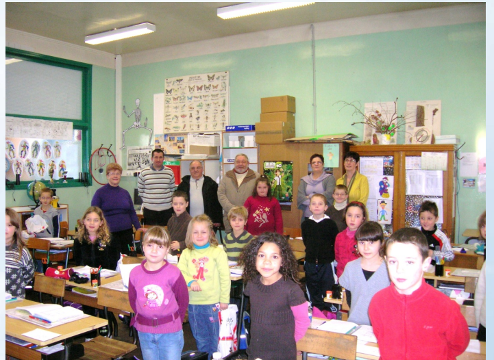
École primaire Jean LEBAS