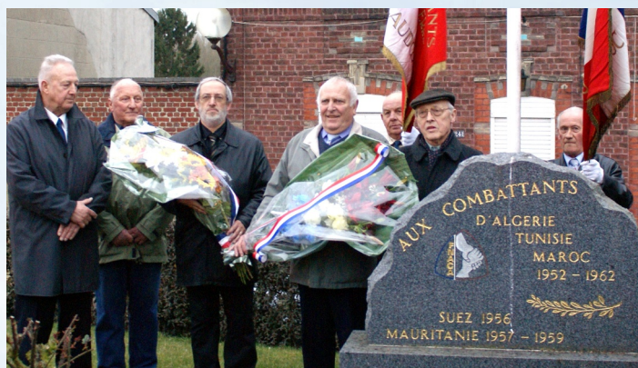
19/03/2010 : 48 e anniversaire du cessez-le-feu en Algérie