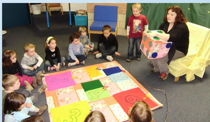
14/04/2010 Heure du conte spécial Pâques à la Médiathèque « Liberté »