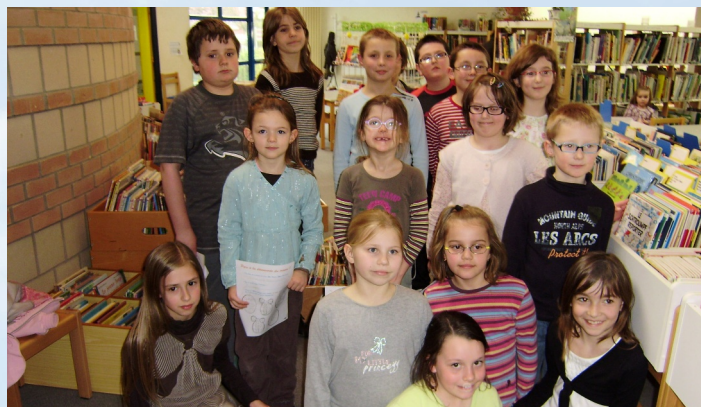
07/04/2010 Chasse aux trésors à la Médiathèque « Liberté »