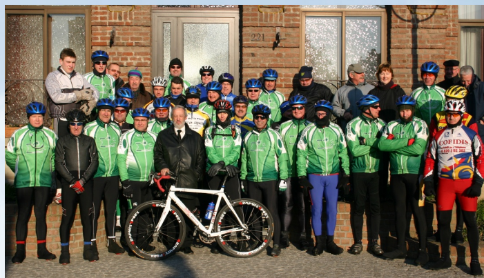
07/03/2010 Cyclo Club : Reprise des sorties dominicales