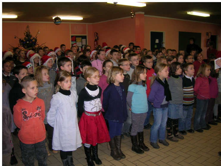
À l'école primaire JOLIOT-CURIE