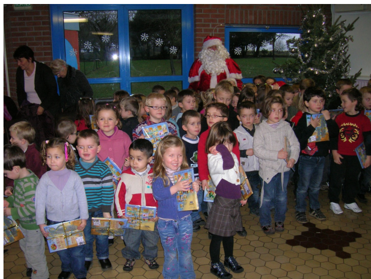
À l'école maternelle Paul LANGEVIN

Les écoliers du primaire ont pu savourer le repas de Noël préparé par les cuisinières des écoles. Quant aux enfants de maternelle, ils ont apprécié le goûter de Noël : brioches et chocolat pour tous.