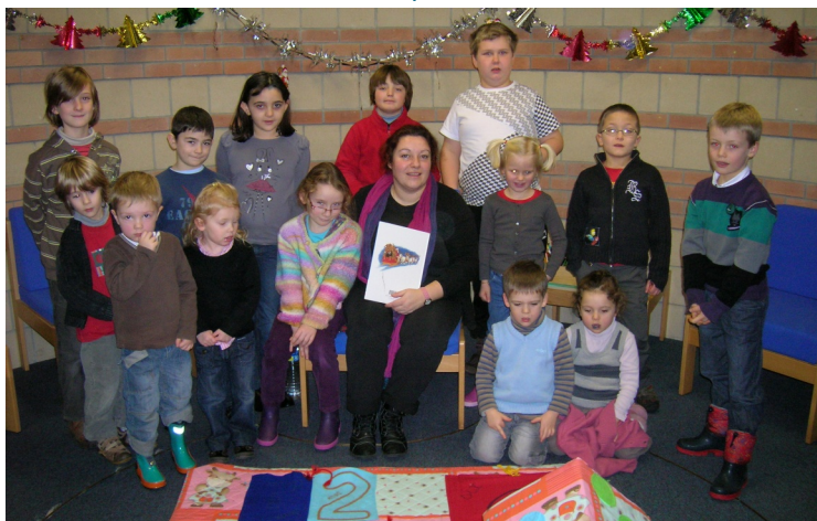
21/12/2010 Heure du conte spécial Noël à la Médiathèque « Liberté »