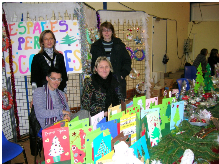
Stand lors du marché de Noël