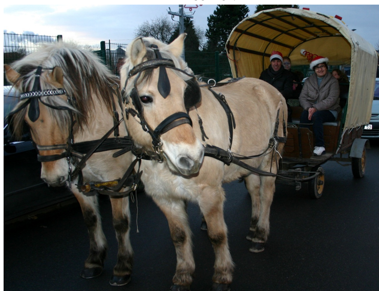
Promenade en calèche