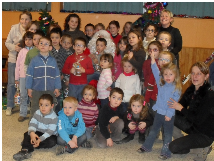
Le Père Noël a été accueilli par les enfants en chansons ; un goûter et un petit cadeau leur ont été offerts.