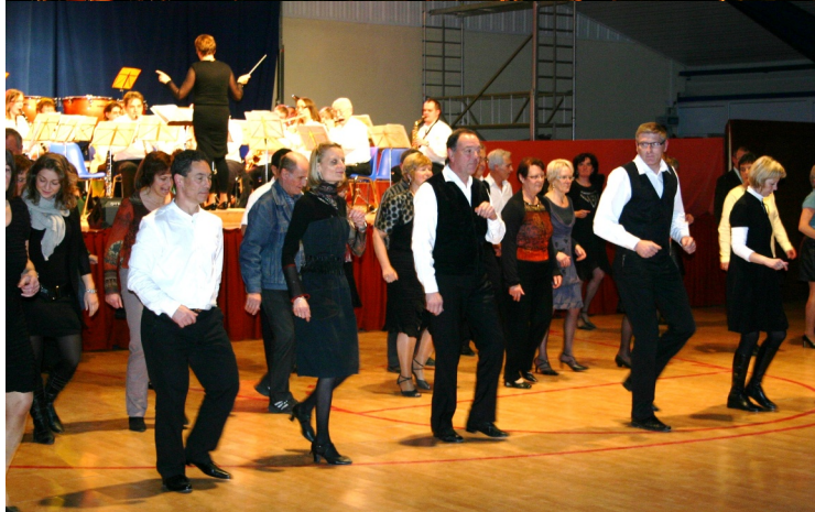
19/11/2010 Concert de Sainte Cécile : L'Harmonie Municipale accompagnée par la Danse de Salon à la salle polyvalente