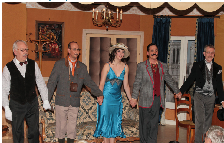
20/11/2010 O.M.C.E. : Théâtre par la Troupe « Le Trait d'Union » à la Médiathèque « Liberté »