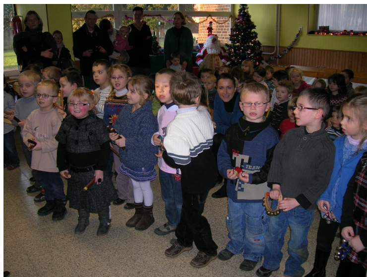
À l'école maternelle Suzanne LANOY