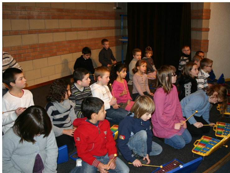
L'école primaire Jean LEBAS à la Médiathèque