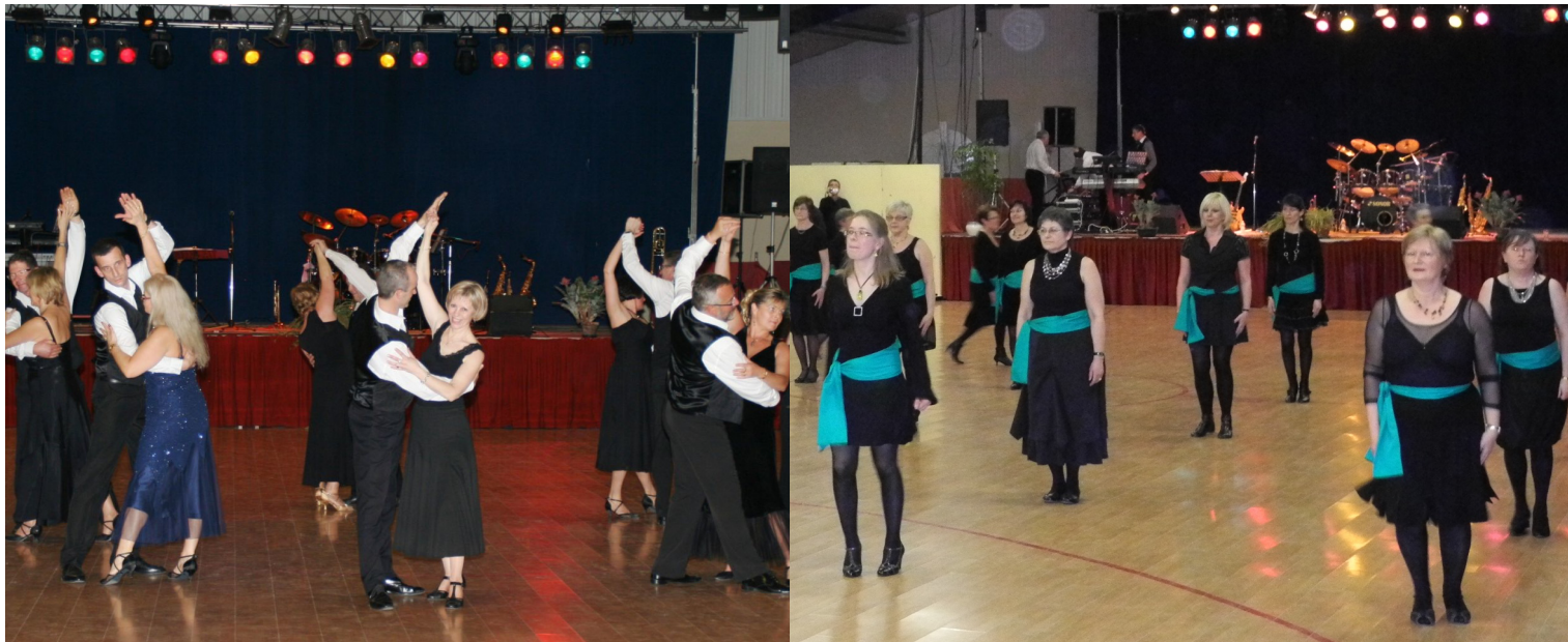
05/02/2011 Grande soirée dansante de la « Danse de Salon » à la salle polyvalente. les adhérents ont fait des démonstrations de bachata, boston lors de cette soirée animée par l'orchestre "Kris BERRY". Un chèque de 200 € a été remis au profit de l'épicerie solidaire.