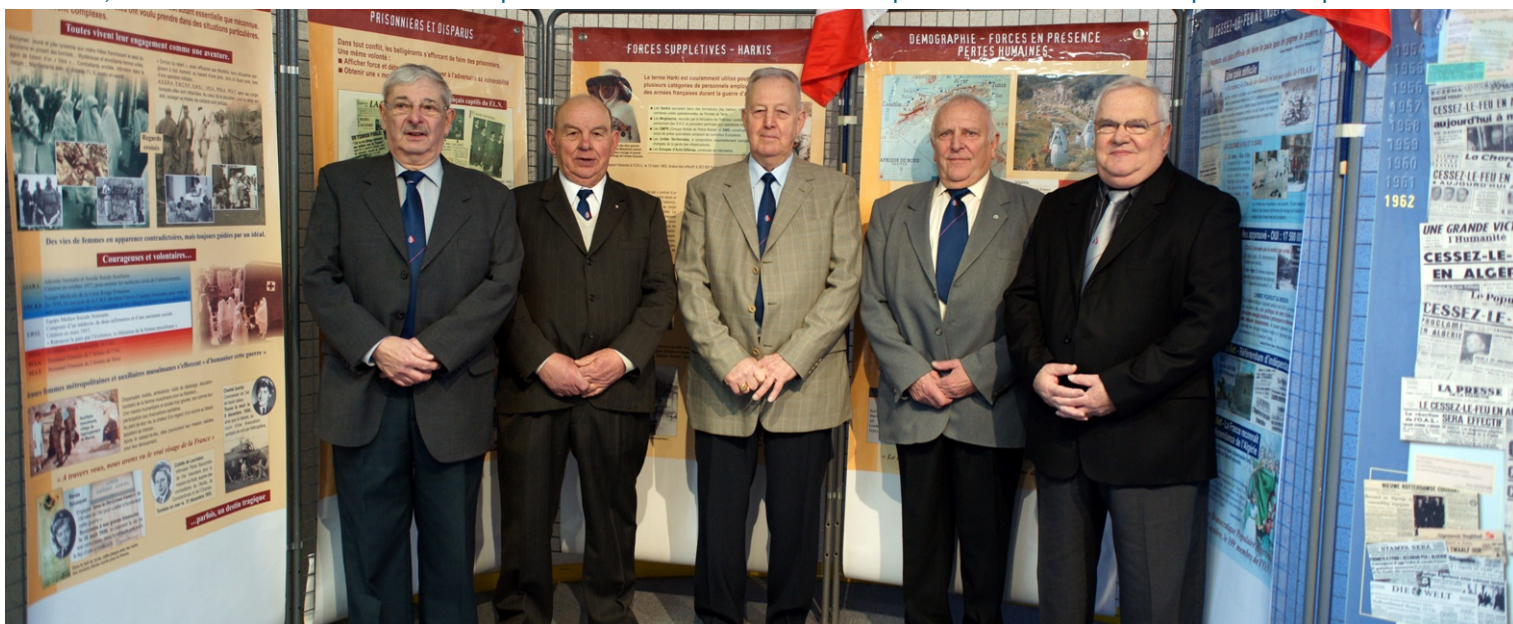
Du 01 au 07/03/2011 Exposition sur la guerre d'Algérie à la Médiathèque « Liberté ». La section locale de la F.N.A.C.A. a organisé une exposition qui a présenté des documents personnels, des photos et des objets rattachés à cette période marquée.