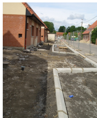
Le Clos de l'Ermitage : pendant les travaux de voirie ...