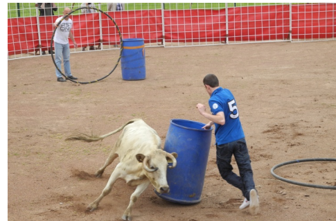
... jeu dans l'arène avec la participation de volontaires qui ont osé affronter les vachettes