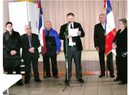
29/04/2012 : Journée du souvenir des victimes de la Déportation