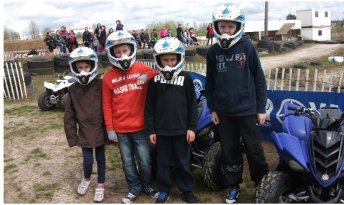
Quads au Cateau-Cambrésis

Il y a eu 90 inscrits avec une fréquentation d'environ 60 enfants par jour maternels et primaires confondus .