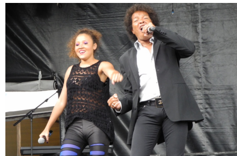
... et le Groupe OTTAWAN