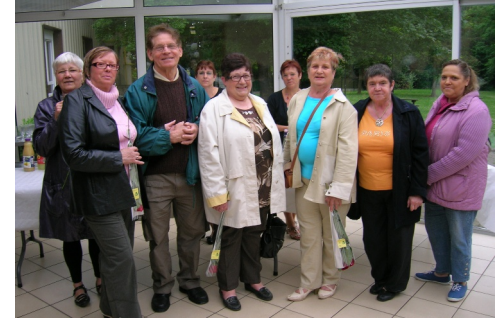
Fête des mamans du 4 juin