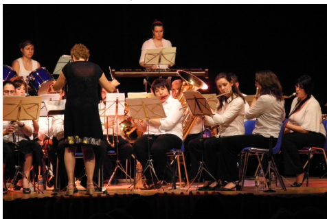
25 juin : Concert de ducasse par l'Harmonie Municipale à la salle polyvalente...