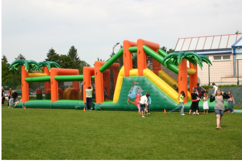
Jeux gonflables pour les enfants des jeunes mamans