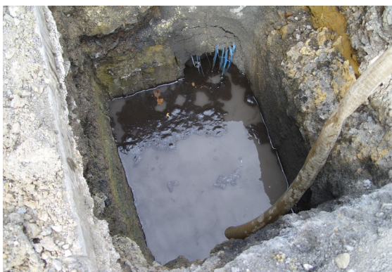
Remplacement des branchements d'eau rue du Marais : un travail long et fastidieux en raison des remontées d'eau de la nappe phréatique