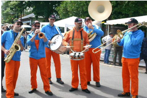
10 juin : Animation par le groupe Brass Couss Band sur la brocante...