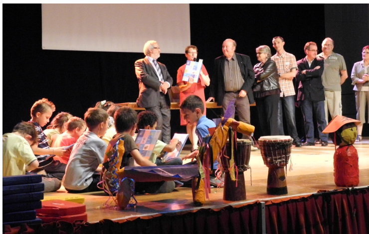
23/06/2012 : Distribution des prix offerts par la Municipalité et remise de calculatrices aux enfants de C.M.2 et de dictionnaires aux grands des écoles maternelles par l'Association des Parents d'Élèves.