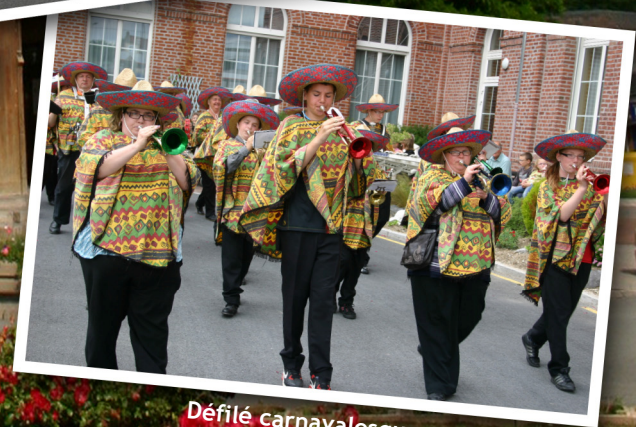
Défilé carnavalesque lors de la brocante