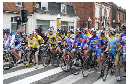
3 juin : Championnat cycliste amateur Nord Pas-de-Calais