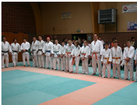
24/06/2012 : Challenge de judo « Édouard TRICQUET » au dojo de la salle Léo LAGRANGE