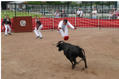
23 juin : Course de vaches landaises face à la salle polyvalente...