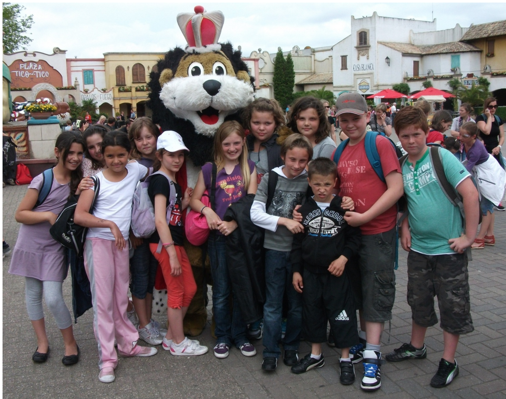
27/06/2012 : Sortie au parc Bellewaerde pour clôturer l'année 2011-2012 des activités périscolaires