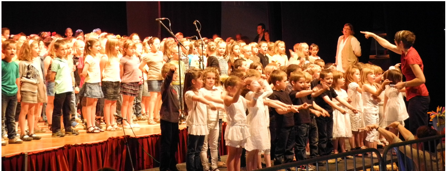
23/06/2012 : Fête des écoles : un voyage autour du monde, spectacle dirigé par M me RATIVEAU, intervenante municipale en musique, puis restauration et buvette tenues par l'A.P.E.