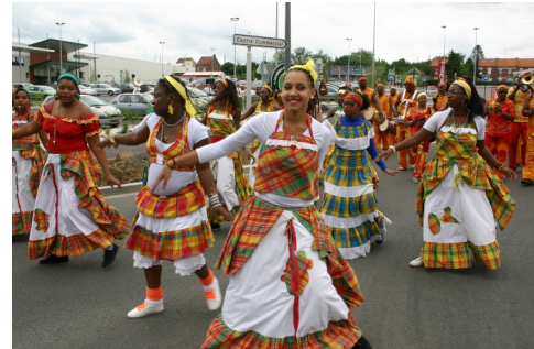
... l'après-midi, défilé carnavalesque