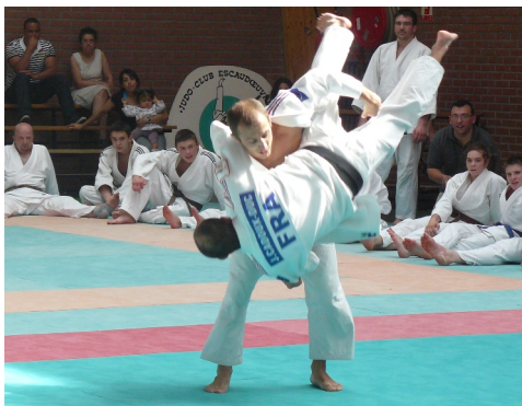
30/06/2012 : Le Judo Ju-jitsu a fêté ses 40 ans au dojo de la salle Léo LAGRANGE