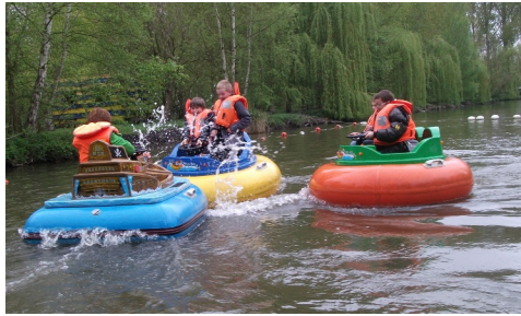
Aquascoters au parc "Le Fleury" à Wavrechain-sous-Faulx