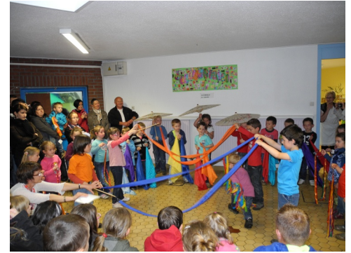
15/06/2012 : Fête à l'école Paul LANGEVIN