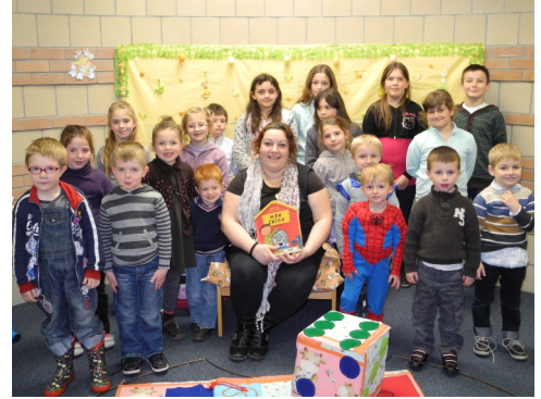
25/04/2012 : Heure du conte de Pâques à la Médiathèque « Liberté »