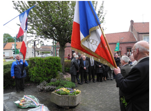
08/05/2012 : 67 e anniversaire de l'Armistice 1945