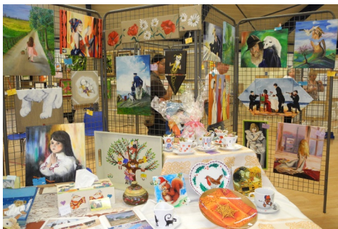
26, 27 et 28 mai : 5 e Rendez-vous des arts et du savoir-faire à la salle polyvalente

N'oublions pas les tickets de manège gratuits distribués aux enfants des 4 écoles de la ville.