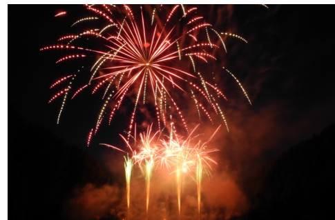
... suivi d'un grand feu d'artifice à l'étang communal