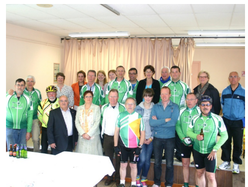
20/05/2012 : Rallye cyclotourisme organisé par le Cyclo Club d'Escaudœuvres