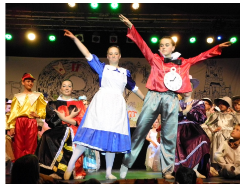
30/06/2012 : Spectacle de fin d'année de l'École Municipale de Danse à la salle polyvalente