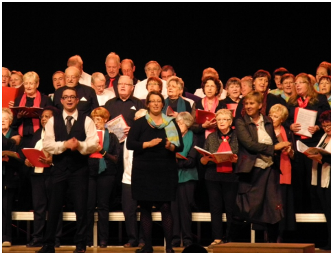
09/11/2012 : Festival de chorales à la salle polyvalente