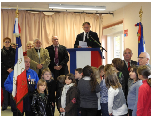
11/11/2012 : 94 e anniversaire de l'Armistice 1918