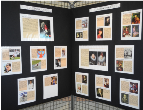
Du 3 au 17/11/2012 : Exposition « Les figures du Cambrésis » à la médiathèque « Liberté »