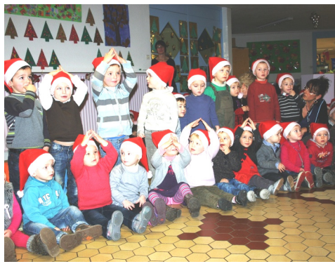
18/12/2012 : Noël à l'école Paul LANGEVIN