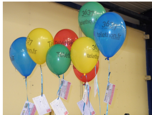
01/12/2012 : Les défilés du 26 e Téléthon avec l'aide de la municipalité et des associations à la salle polyvalente