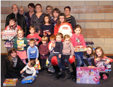
22/12/2012 : Arbre de Noël des enfants du personnel à la médiathèque « Liberté »