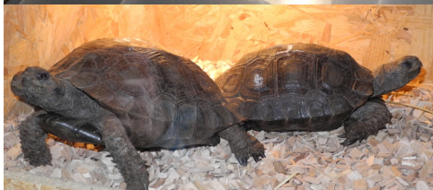
17/02/2013 : 3 e salon international terrariophile organisé par l'A.E.N.A. à la salle polyvalente