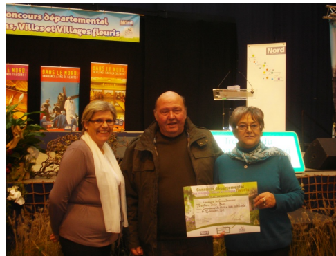
24/11/2012 : Remise des prix du concours départemental des villes et villages fleuris à Gravelines