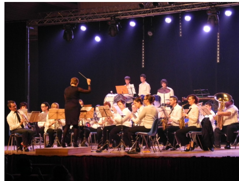
23/11/2012 : Concert d'automne de l'Harmonie municipale à la salle polyvalente

1 er adjoint au maire, adjoint à l'urbanisme