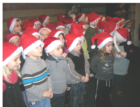
17/12/2012 : Noël à l'école Suzanne LANOY