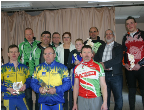
17/02/2013 : Rallye cyclotourisme « La Scaldobrigienne » n° 14