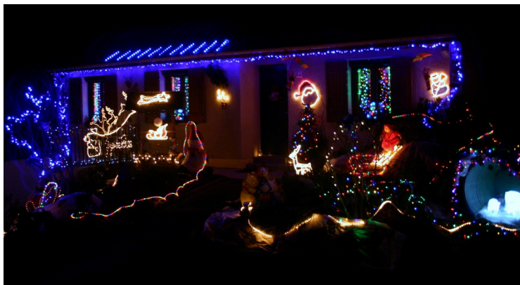
1 er prix