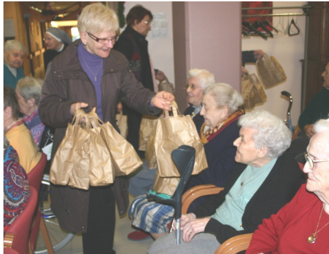
29/12/2012 : Distribution de colis de Noël par les membres du C.C.A.S. aux résidents de « Ma Maison »