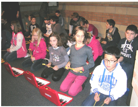
17/12/2012 : Noël à l'école Jean LEBAS