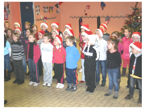
18/12/2012 : Noël à l'école JOLIOT-CURIE