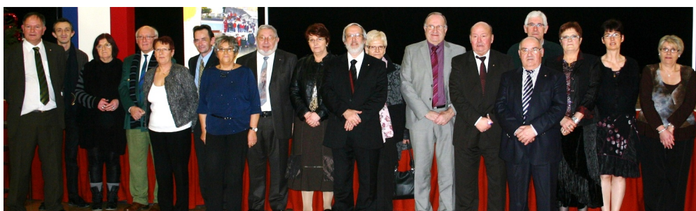
Une partie du conseil municipal