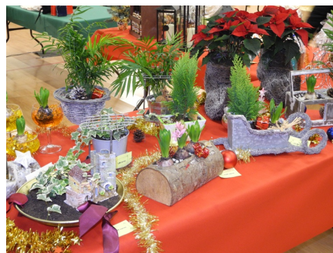
08 et 09/12/2012 : Marché de Noël à la salle polyvalente