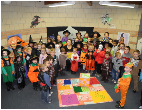
31/10/2012 : Heure du conte d'Halloween à la médiathèque « Liberté »