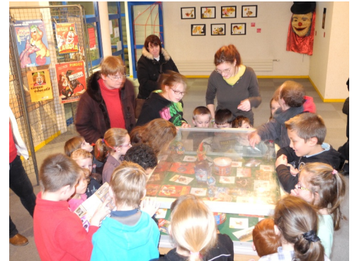
Du 5 au 18/01/2013 : Exposition « Cirqu'ouvert » à la médiathèque « Liberté »