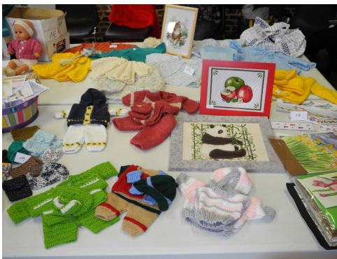
10/11/2012 : Atelier créatif de l'O.M.C.E., exposition-vente au centre Benoît FRACHON