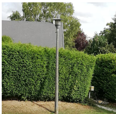
Ancien poteau d'éclairage