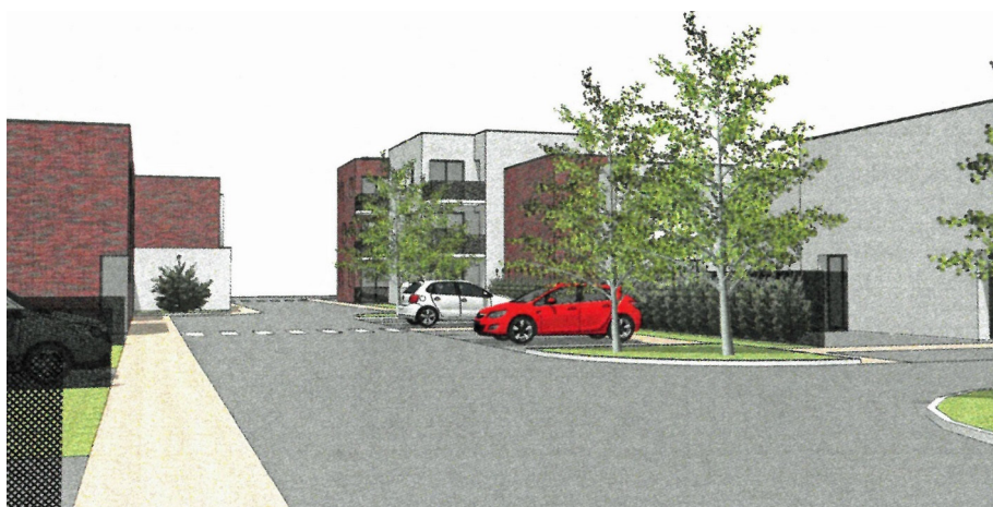
Vue de la voirie depuis la parcelle construite