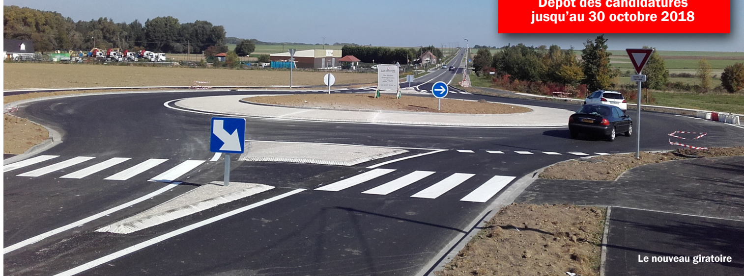
Le nouveau giratoire

Dépôt des candidatures jusqu'au 30 octobre 2018