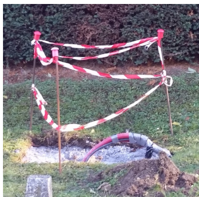
Préparation du travail pour un nouveau poteau d'éclairage à LED

La rénovation de l'éclairage public a débuté dans cette résidence près de la route de Naves. Cet équipement nouvelle génération à LED, sera plus économique avec une diminution de l'intensité lumineuse de 23 heures à 5 heures.