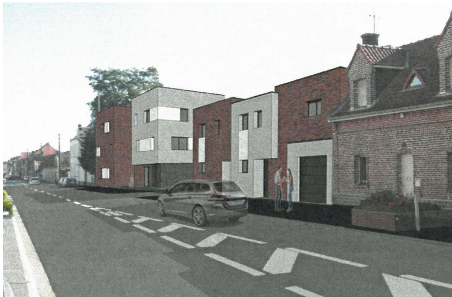
Insertion du projet dans son environnement : vue depuis la rue Jean Jaurès

Les dossiers de Partenord Habitat seront à retirer en mairie.