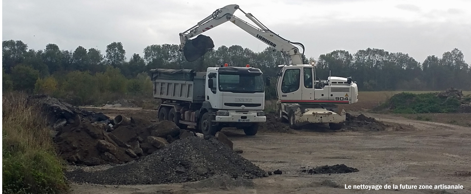
Le nettoyage de la future zone artisanale