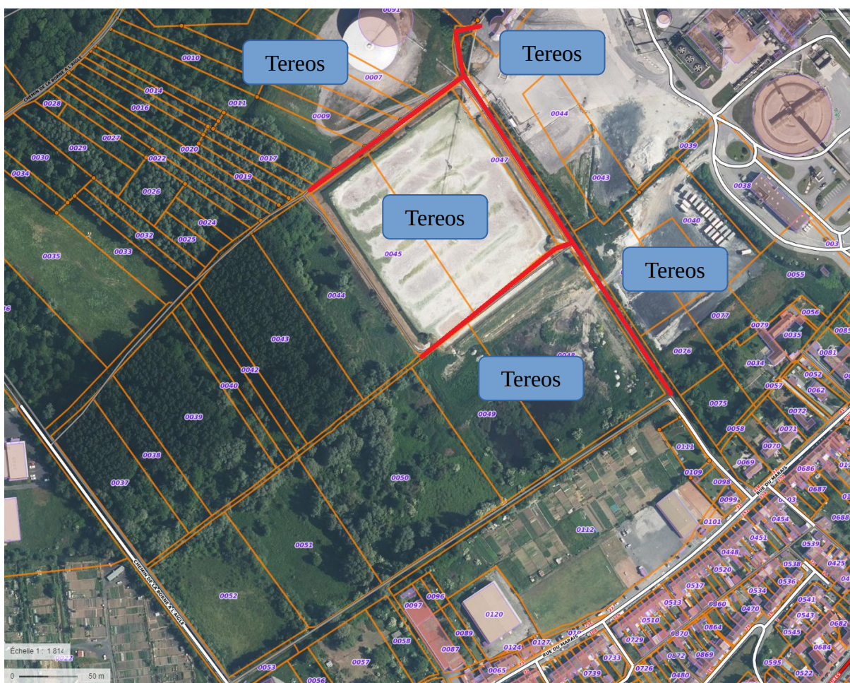
Localisation des chemins et fossés au sein de l'entreprise TEREOS

La Commune a donc constaté directement leur désaffectation, ne satisfaisant plus un intérêt général, et souhaite dorénavant lancer une enquête publique nécessaire à l'aliénation prochaine de ces chemins.